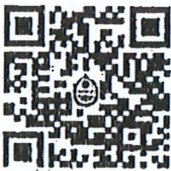
แบบคำร้องขอโอน

ผู้อำนวยการสำนักงานคณะกรรมการนโยบายที่ดินแห่งชาติ