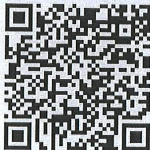
แบบฟอร์มหนังสือขอโอนฯ

เลขาธิการสำนักงานมาตรฐานสินค้าเกษตรและอาหารแห่งชาติ