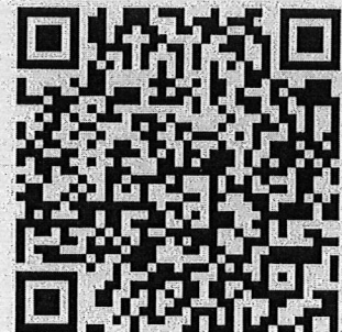
หน้าที่ความรับผิดชอบของตำแหน่งฯ