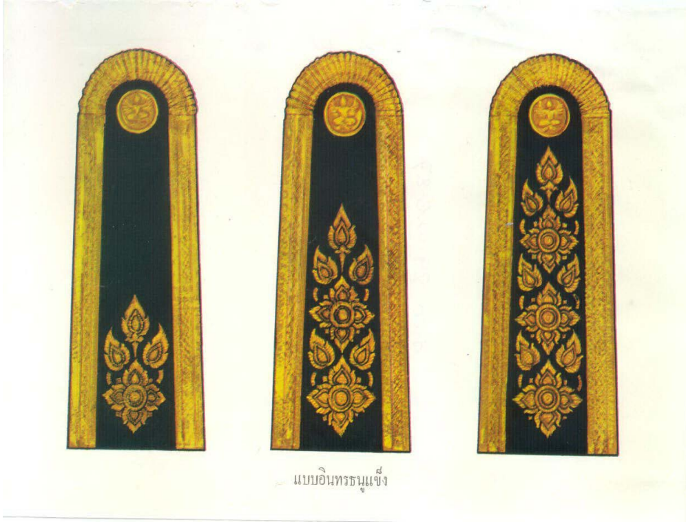
แบบอินทรีนูนแดง